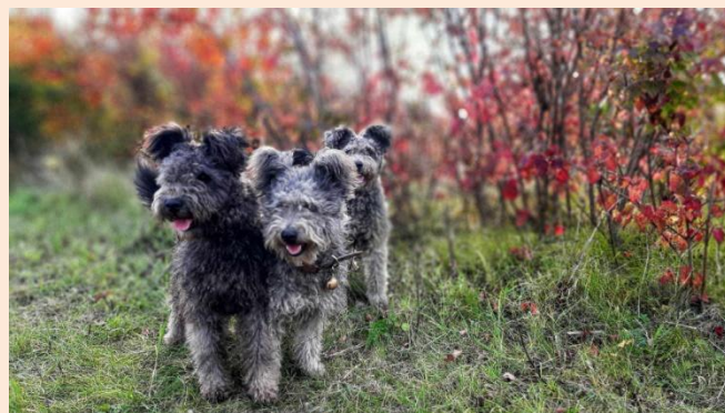
Terelő-Tekergő Üde, Rozi, Tücsök