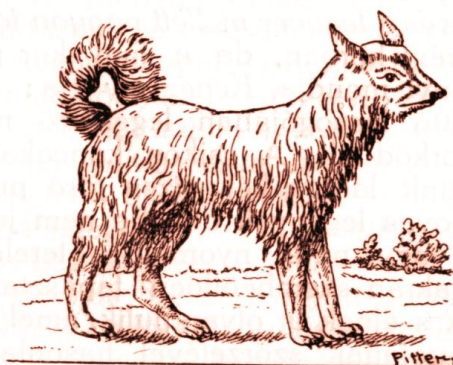
73. Pumi őrzőkutya. (Pethe után.)

-Ennek feje legjobban közelít a rókáéhoz... ” A képaláírás tehát PUMI, azonban a szöveges részben láthatóan nem a ma így ismert kutya szerepel.