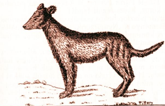
Kuvasz őrző kutya. (Pethe után.)

Ugyanitt tanulságos a „ kovasz őrző kutya ” leírása is: „... nagyságára olyanforma, mint egy kőök-farkas; fülei fennálló k, szőre valamennyire bolyhos, legalább nem sima, a' farka kerekedése pedig alólról, bojhos; színe gyakran barnás-fekete, de különben számtalan, többnyire szennyes-színű...” Amint látjuk, ez a kutya semmiképpen nem lehet a kuvasz, hiszen kis termetű, és mindenféle színű, felálló fülű. Mai fogalmaink szerint sokkal inkább a pumit ismerhetjük fel a leírásban.